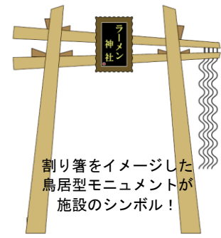
割り箸をイメージした鳥居型モニュメントが施設のシンボル！

なお、同施設のお披露目・公開開始はレトロ横丁初日のオープニングセレモニー後、イベント終了後も常設公開となる。（入館無料）