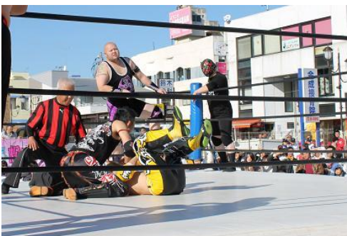
詳しい選手プロフィールはWEBで！ [ SED プロレス ]で検索・チェックしよう！

昭和28年テレビ放送が開始。2月にNHK東京テレビジョンの初任給が5000円をようやく超えた時代、1台20万円以上するテレビは極めて高価なものだった。 商店などが客寄せのために設置したテレビや、日本テレビが普及を目的に設置した「街頭テレビ」には多くの人が集まった。繁華街や駅前広場など関東一円の55箇所設置された街頭テレビは約220台。 特に人気があったのは、プロ野球、プロボクシング、大相撲などのスポーツ番組であった。中でも新しいスポーツとして登場したばかりのプロレスに人気が集。そのスーパースターがまさに「力道山（りきどうさん）」だった。 プロレス初興行を行った力道山がリング上で空手チョップを炸裂させ、アメリカ人レスラーを次々と倒すさまに、日本中の人々は熱狂した！