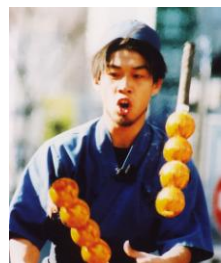
▲「彦一団子」ジャグリング