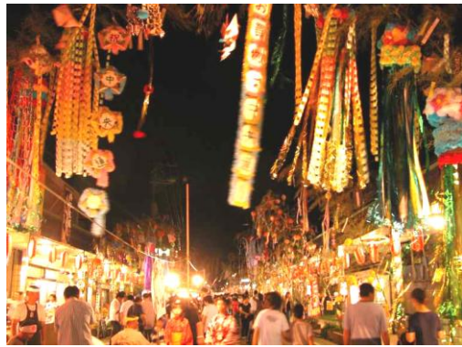
～第1回開催時のレトロ横丁（平成17年）～