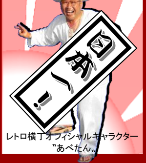
レトロ横丁オフィシャルキャラクター「あべたん」