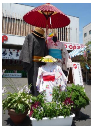
ゆかた・帯・下駄の 持ち込みによる 着付け大歓迎だよ!

喜多方レトロ横丁の雰囲気存分に堪能 するにはやはり浴衣姿で会場を歩いてみる こと。下駄の「カランコロン」という音 が心地良く、まさにレトロ横丁にぴったり！ より一層イベントを楽しむことができる。 プロの着付師と美容師によるゆかたの無料貸し 出しや無料着付け、ヘアアレンジサービスは好 評で毎年楽しみにしているファンも多い。 さらにサービス利用者には髪飾りを一点プレゼ ントという嬉しい特典付き。 浴衣を着ている方に限り、カメラマンによる 記念撮影もあるよ!