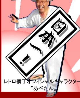
レトロ横丁オフィシャルキャラクター「あべたん」