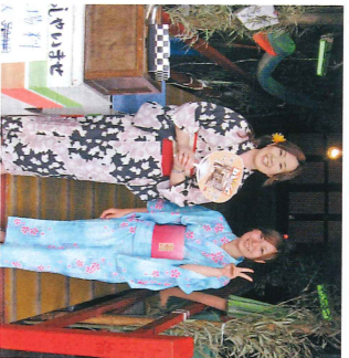
※下駄のレンタルはなし