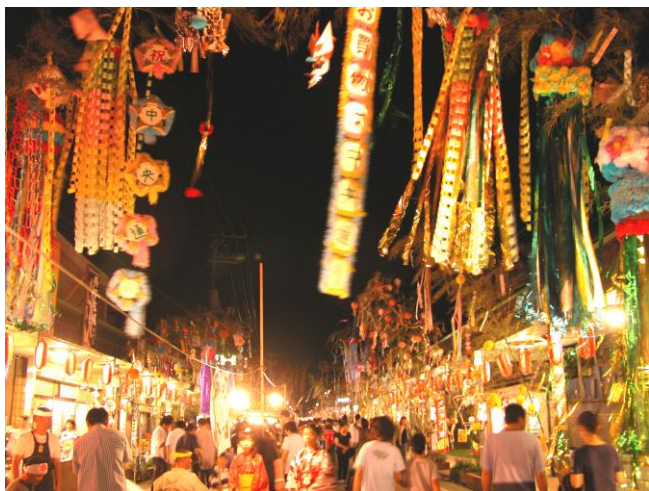
幻想的な雰囲気を出す夜のレトロ横丁

東日本大震災復興応援イベント ～喜多方から元気発信～ 喜多方の夏…いよいよ明日から開幕